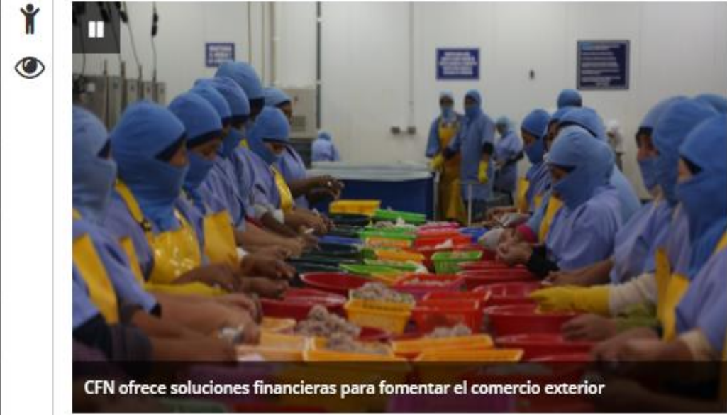
CFN ofrece soluciones financieras para fomentar el comercio exterior